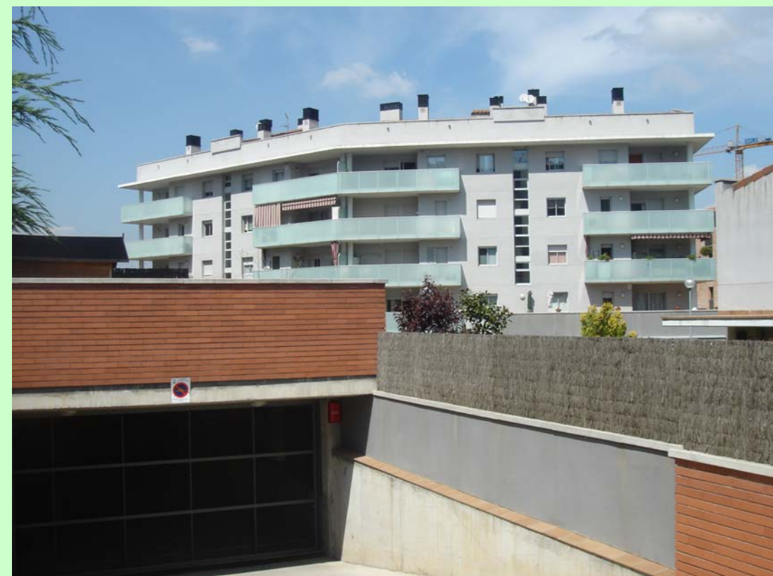
Edicat (Montornés del Vallés).