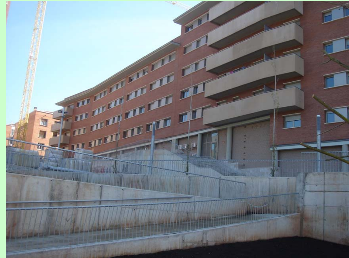
Dragados / Urbis. (Manresa). Façana Posterior