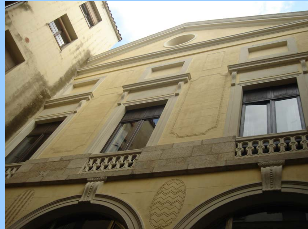
Teatre Municipal de Girona. Façana Principal