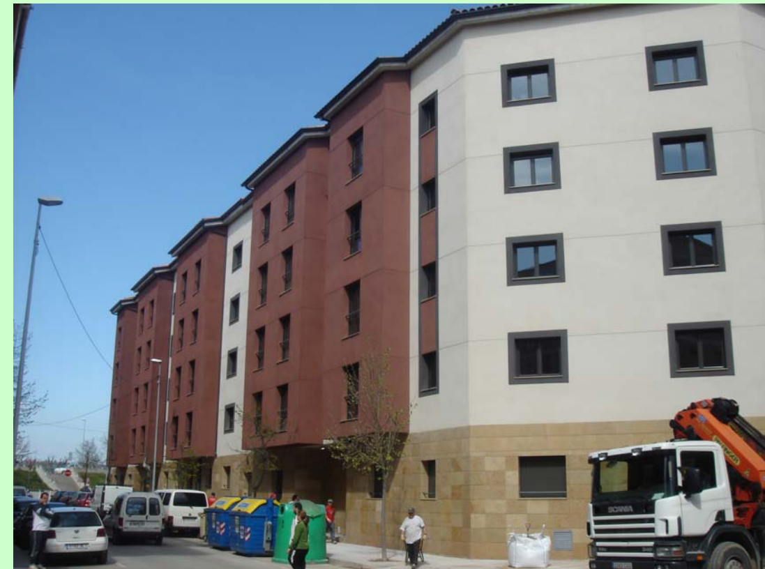
Edicat (Montornés del Vallés).