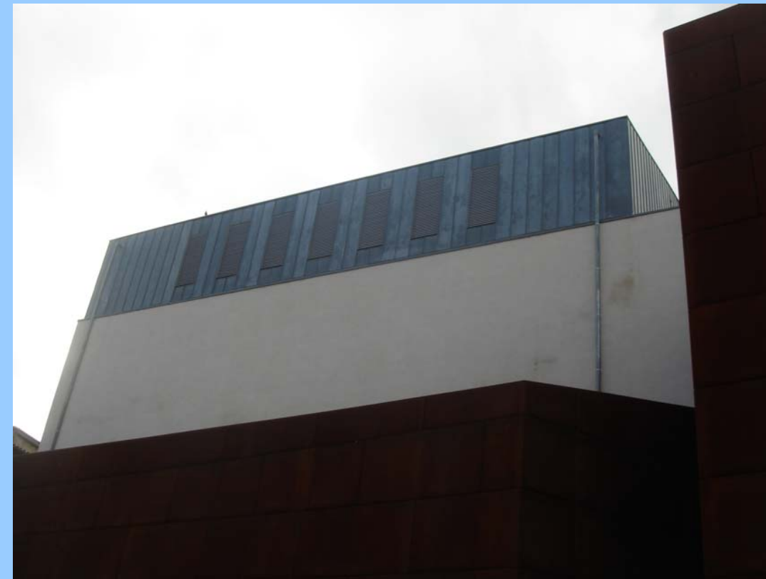
Teatre Municipal de Girona. Destaquen els elements de Formigó vist