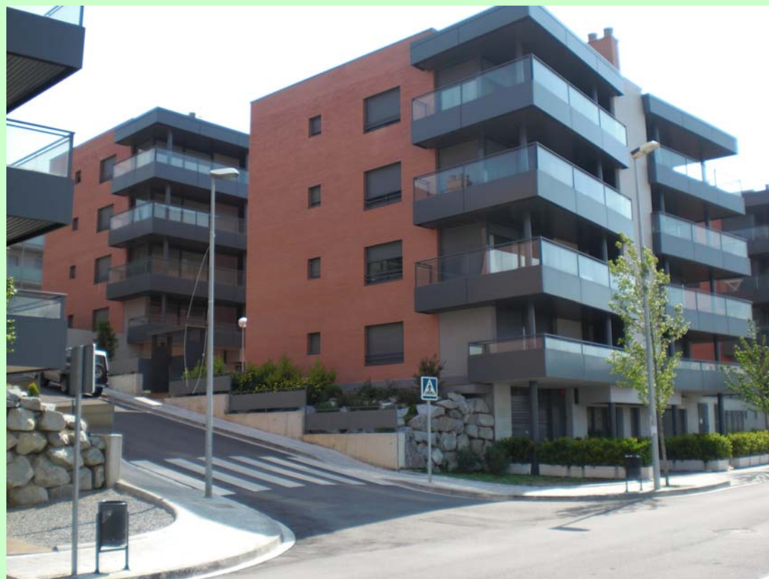
Construccions Pai /Vallehermoso (Gelida). "El Mirador de Gelida". Es tracta d'una Promoció de 14 edificis d'habitatges Plurifamiliars.