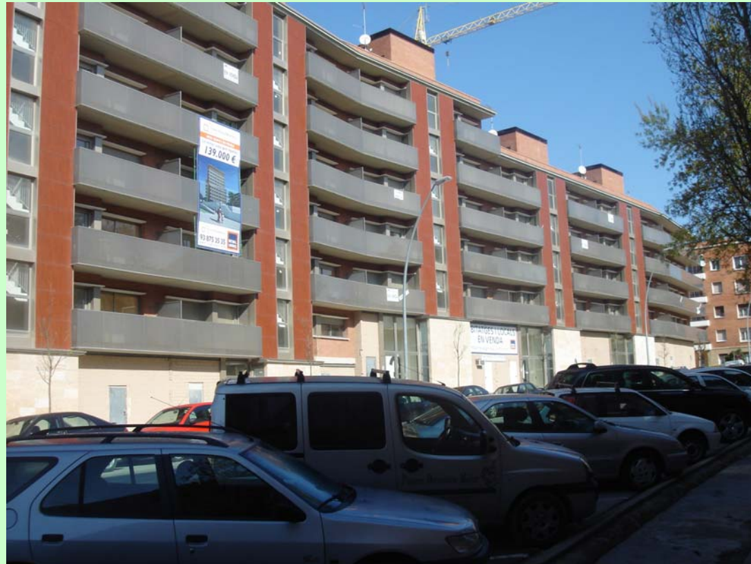
Dragados / Urbis. (Manresa). Façana Principal