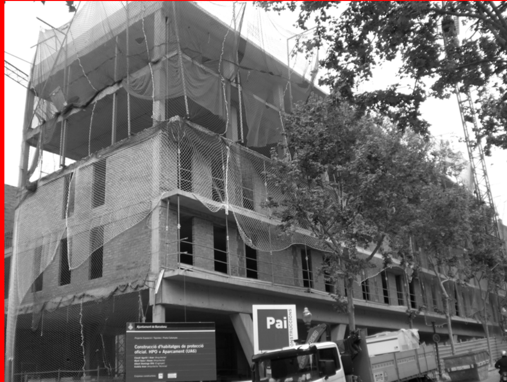
Construccions Pai / Patronat Municipal de L'Habitatge. 31 Habitatges de Protecció Oficial al Poble Sec (Barcelona)