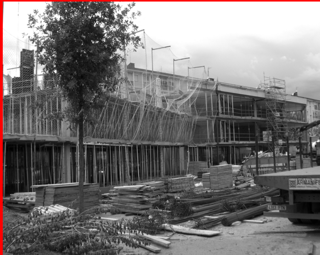
Construccions Pai / GISA. CEIP a Cornellà. Fase d'Estructura.