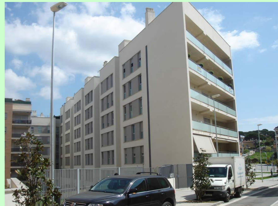
Dragados / Metrovacesa ( Montornés ). Façana Posterior