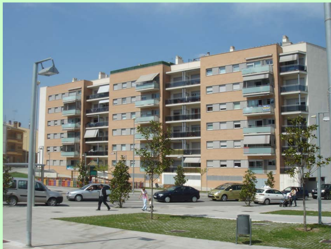
Dragados / Metrovacesa ( Montornés ). Façana Principal (Edifici en L)