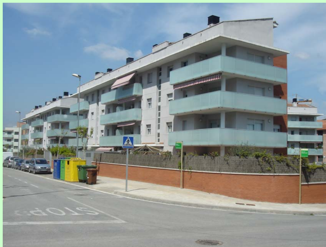
Edicat / Grup Preyco(Montornés del Vallés). Es tracta d'una Promoció d'edificis d'habitatges Plurifamiliars amb ocupació de tota l'illa