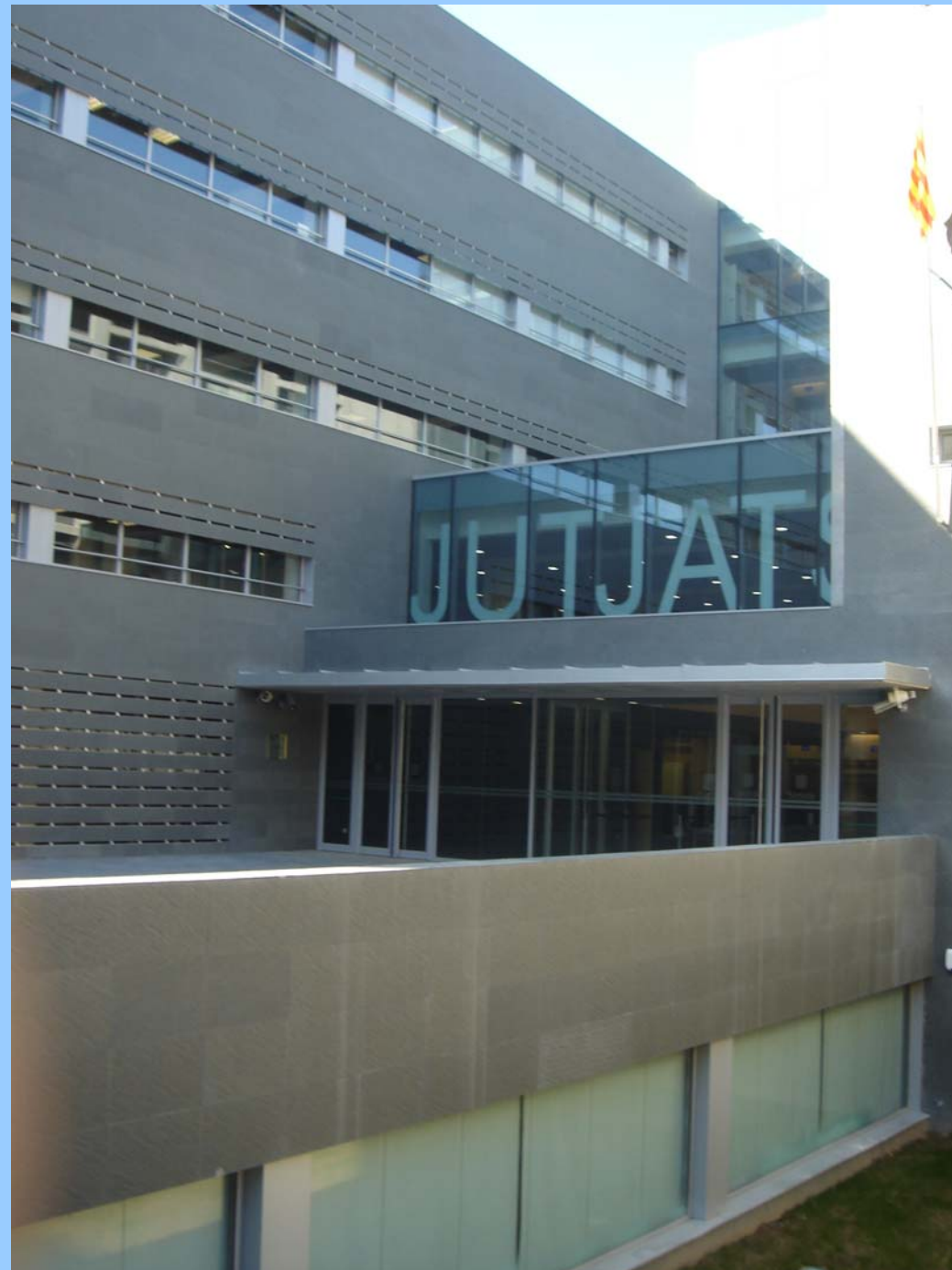
Construccions Pai. Jutjats de Manresa.