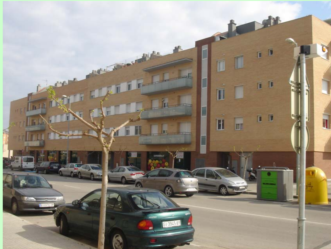
Edicat / Grup Preyco (Lloret de Mar). Fase 1 a . Edifici en forma de L. Part de la Façana Principal.