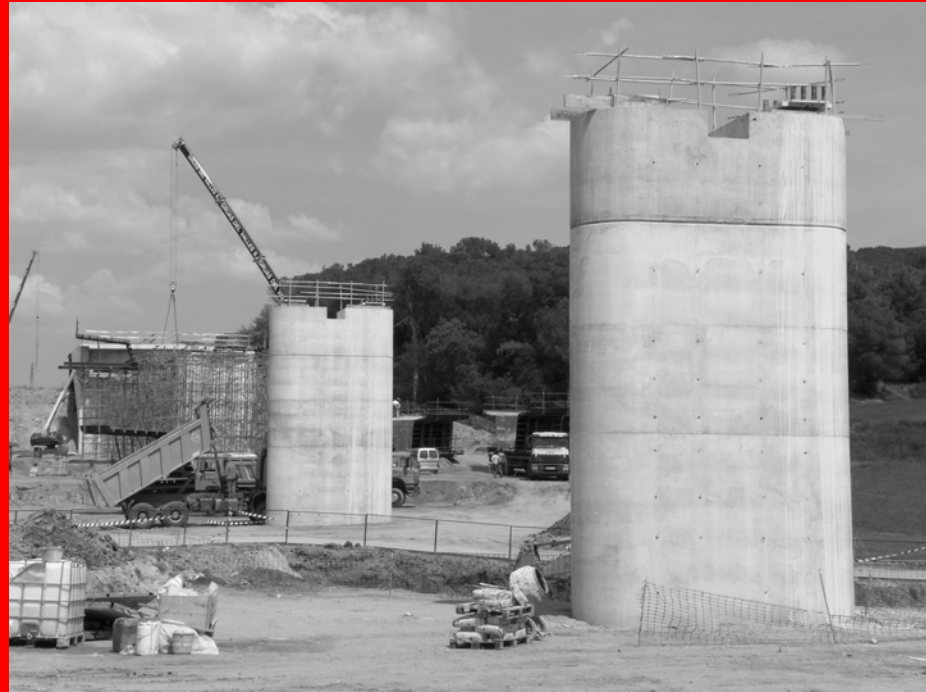
Aldesa / Adif. Nou Tram de l'Ave a Montornés del Vallés. Execució de Pilars i Mensures en Ponts.