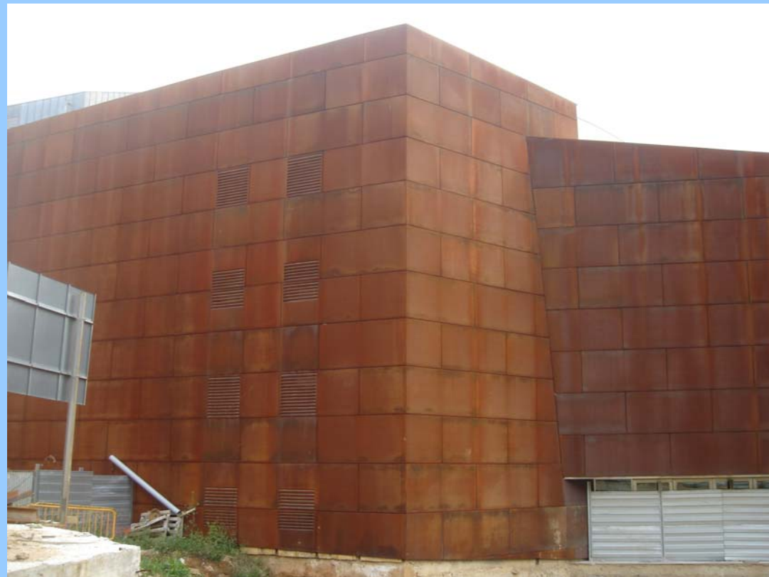
Teatre Municipal de Girona. Cos de l'edifici. Canvis Volumètrics