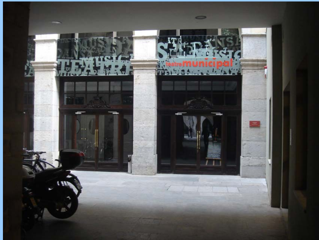
Teatre Municipal de Girona