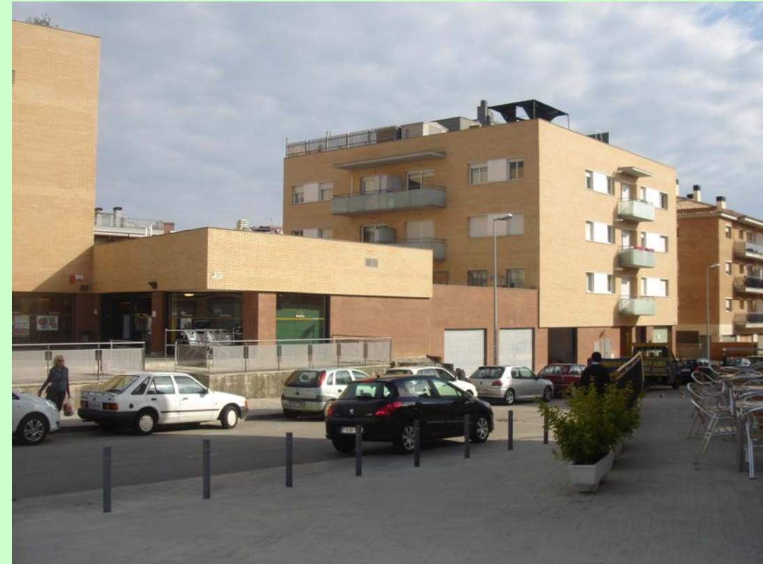
Edicat / Grup Preyco (Lloret de Mar). Edifici en forma de L. Part de la Façana Principal.