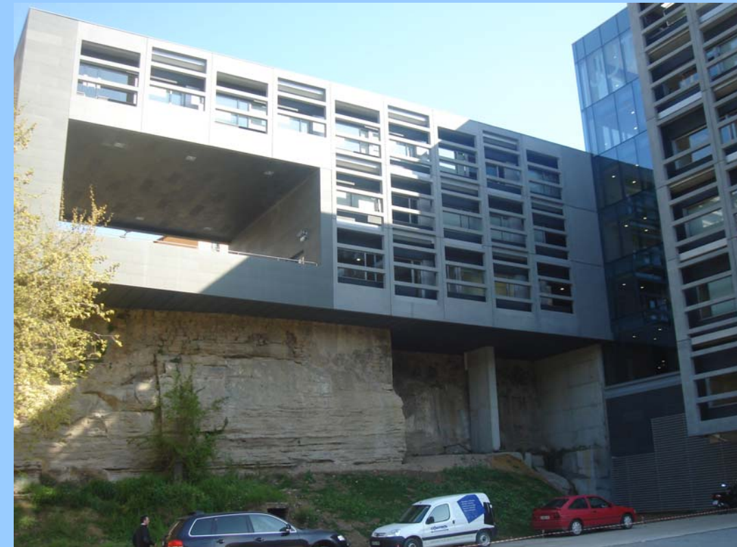
Jutjats. Elements Vistos de Formigó Armat de gran complexitat.