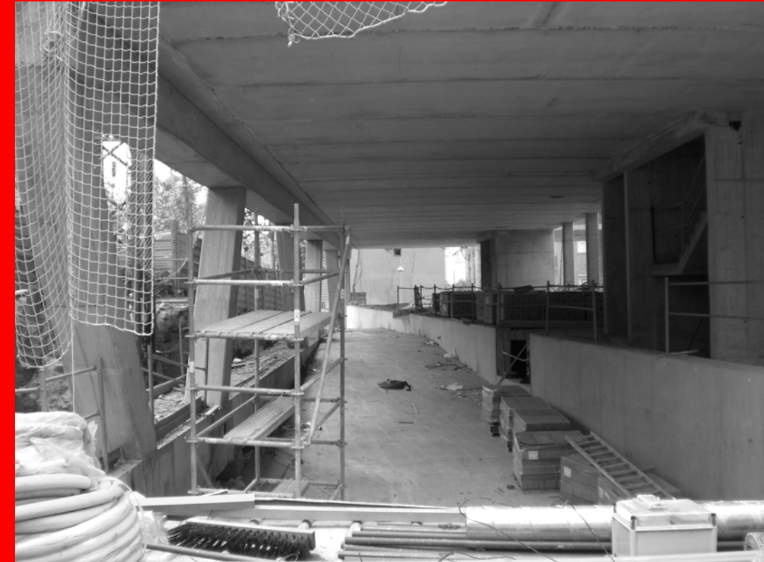
Construccions Pai / Nou carrer per l'interior de l'edifici. Destaca el mur vist perimetral així com els pilars en forma de V.