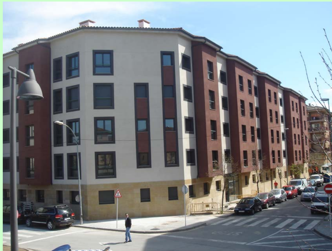
Edicat (Montornés del Vallés). Es tracta d'una Promoció d'edificis d'habitatges Plurifamiliars amb ocupació de tota l'illa.