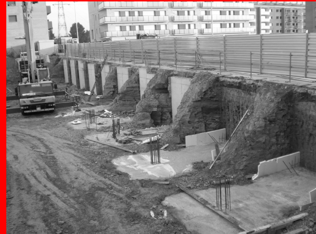
Construccions Pai / IMPSOL . 55+15 Habitatges de Protecció Oficial a Rubí. Fase Fonamentació.