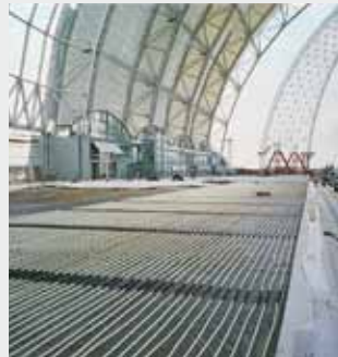
Centro Logístico Cargolifter Berlín (Alemania) Suelo radiante