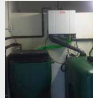
Colegio en Barcelona Reutilización de aguas grises mediante MBR Aquaserve