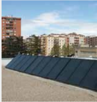
Centro sanitario Logroño (La Rioja) Energía solar térmica