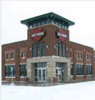
Oficinas de ventas Harley Davidson West Michigan Suelo radiante