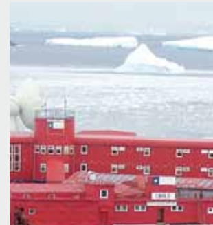
Base militar de la Armada Chilena en la Antártida Reutilización de aguas grises, depuración de aguas residuales, depósitos para gasóleo y agua potable