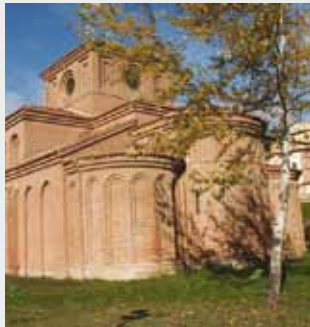
Iglesia de Santiago Salamanca Suelo radiante