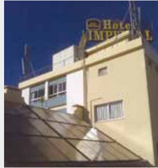
Hotel Imperial Aveiro (Portugal) Energía solar térmica