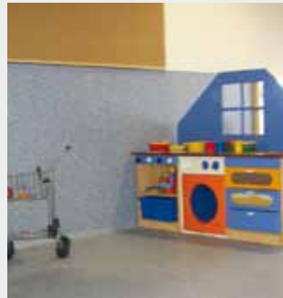
Guardería Municipal Tudela (Navarra) Suelo Radiante