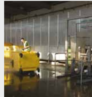
Mancomunidad de Residuos Urbanos La Ribera en Tudela (Navarra) Depuración de aguas residuales