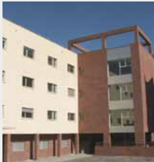
Residencia geriátrica Tudela (Navarra) Energía solar térmica y suelo radiante