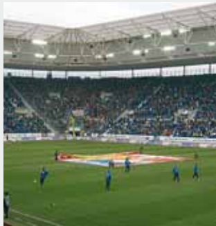
Rhein Neckar Arena (Estadio de fútbol del TSG Hoffenheim) Suelo radiante