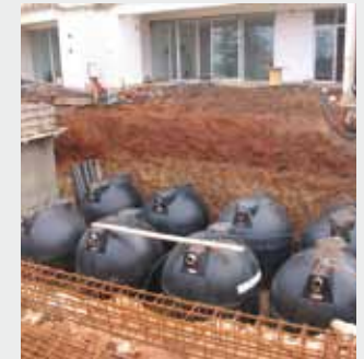
Urbanización residencial de lujo "Melrose Beach" en Boulevard de La Corniche, Casablanca (Marruecos)