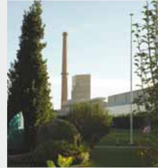
Guardian Industrias Navarra SLU Tudela (Navarra) Depuración de aguas residuales

PROYECTOS Estudios y presupuestos personalizados de cada proyecto. Contacte con nuestros Departamentos Técnicos. ☎ 948 844 406