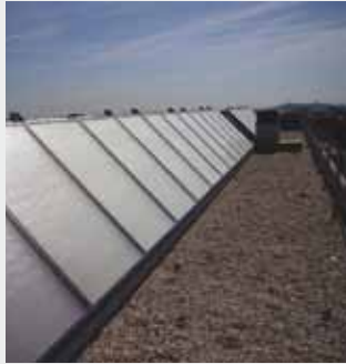
Edificio 138 viviendas Getafe (Madrid) Energía solar térmica