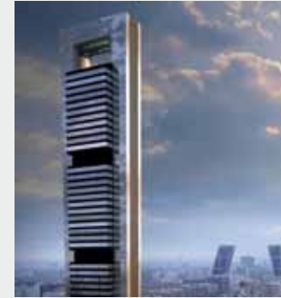
Torre Caja Madrid Depósitos de acumulación Rothagua para sistemas contraincendios