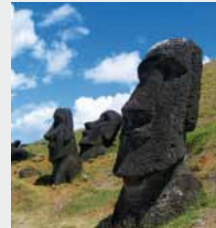
Rapa Nui, Isla de Pascua (Chile) Sistemas de depuración de aguas residuales urbanas para varios municipios