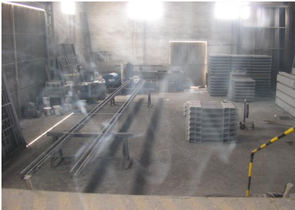
Área de pintura y almacén