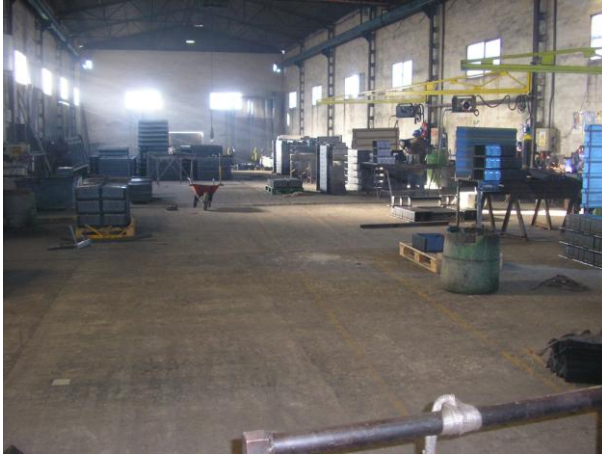
Área carga y descarga