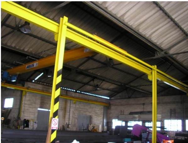
Área Corte y confección material